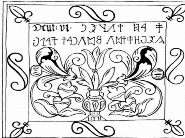
Az énlakai templom rovásfelirata

Az egy Istenhitre utaló nyomokról árulkodnak a feltárt magyar sírokban talált mellkeresztek is, melyekről ugyancsak hallgat a legtöbb történelemkönyv. Ezek a mellkeresztek ezüstből készültek, és a halottak mellére helyezték azokat. Eme ismert szimbóluma a keresztyénségnek ugyancsak arra utal, hogy az ősmagyarok igenis ismerhették és gyakorolhatták az egyistenhitet. A kereszteket megtalálták a honfoglalás-kori tarsolylemezen, a nők nyakában - bizánci kereszt formájában - valamint a szabadkai temetőben egy övcsaton, áldást osztó aggastyán alakjában is.