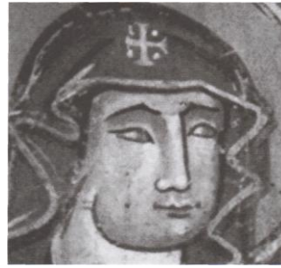
A gelencei Szt. Imre templom freskója

Fontos bizonyítékként szolgál a gelencei templomban talált Mária kép is, hiszen a XIV-XV. században festett képen jól látható a mellkereszt motívum, ugyanakkor rovásírásos feliratok is találhatóak a ruháján. Látható tehát, hogy a kép alkotójának több száz évvel a honfoglalás után is fontosak az ősi magyar szimbólumok. Ez jelzésként is felfogható, hiszen a művész tisztában volt az ősi kultúra és vallás jelentőségével. Szent Máriát ez a festő is Boldogasszonnyal azonosítja.