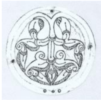
Az életfa ábrázolása

A fákat és köveket a különböző temetkezési szertartásokon is felhasználták, a sírhelyeket ezzel takargatták be, hogy a halott lelke nyugalomban pihenhessen.